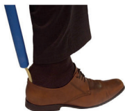
Chausse pied + crochet d'habillage - 12,90€