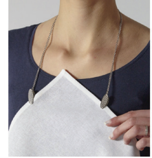
Chaîne attache serviette - 4,90€