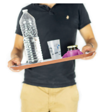
Plateau repas antidérapant - 9,90€