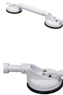
Barre de maintien ventouses - 22,90€