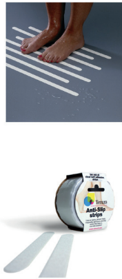
Lot de 30 bandelettes antidérapantes - 9,90€