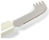
Couteau compensé Nelson - 9,90€