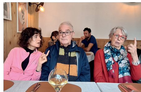
Au restaurant, Lusigny-sur-Barse

Et partager des repas sains et équilibrés).