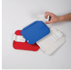
Planche de préparation - Ornamin - 25,42€