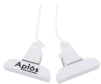
Pince Aida 4,90 €