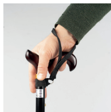
Canne de marche pliante - 13,90€