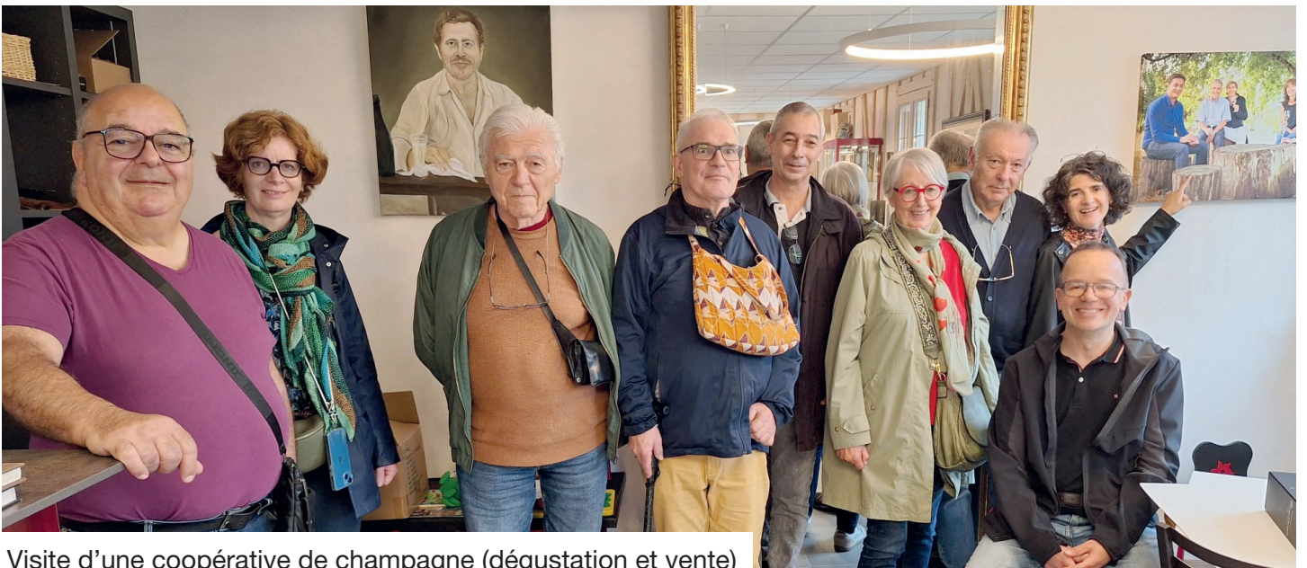
Visite d'une coopérative de champagne (dégustation et vente)