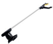
Pince de préhension Handi Reacher - 9,90€

Les produits doivent être retournés neufs, complets, intacts et dans leur emballage d'origine.