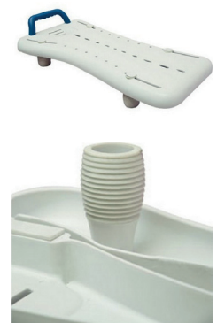
Planche de la baignoire 29,90€