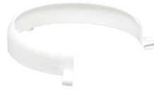
Rebord d'assiette incurvé - 3,90€