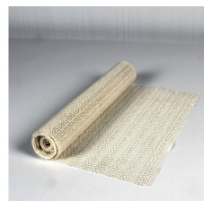
Tapis anti-glisse 5,90€