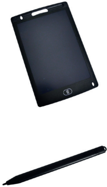
Ardoise électronique - 9,90€